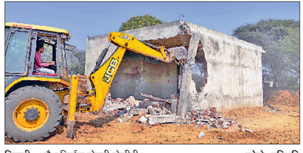
भिवानी। अवैध निर्माण तोड़ती जेसीबी।