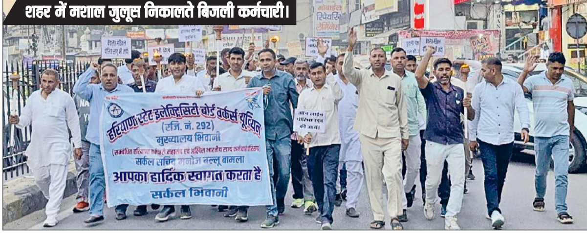
शहर में मशाल जुलूस निकालते बिजली कर्मचारी।