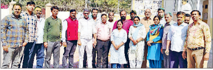
भिवानी। वैश्य कॉलेज में एक दूसरे को गुलाल अब्बीर लगाते हुए।

हरिभूमि न्यूज ▶▶ भिवानी होली रंगों का ही नहीं, बल्कि भाईचारे एवं आपसी सौहार्द का सबसे बड़ा पर्व माना जाता है, जिसे पूरा भारत वर्ष बड़ी धूमधाम से मनाता है। इस पर्व पर हम सभी को आपसी भेदभाव भूलाकर आपस में मिलजुलकर रहना चाहिए। यह बात वैश्य महाविद्यालय भिवानी परिवार द्वारा महाविद्यालय प्रांगण में मनाई गए फूलों एवं तिलक की होली मनाते हुए महाविद्यालय के