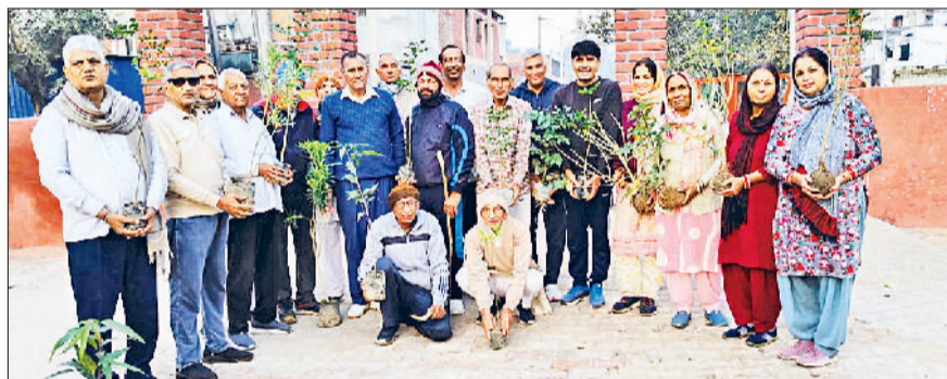
भिवानी। स्वतंत्रता सेनानी पंडित नेकीराम शर्मा पार्क में पौधरोपण करते कमेटी सदस्य।